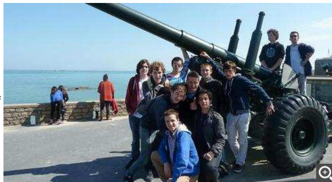
Les visites ont permis aux lycéens d'avoir un contact plus réel avec la Première Guerre mondiale.