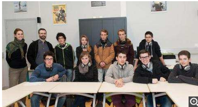
Le groupe suivra quatre ateliers, une sortie au théâtre auditorium de Poitiers pour un concert d'Ars Nova est également programmée.