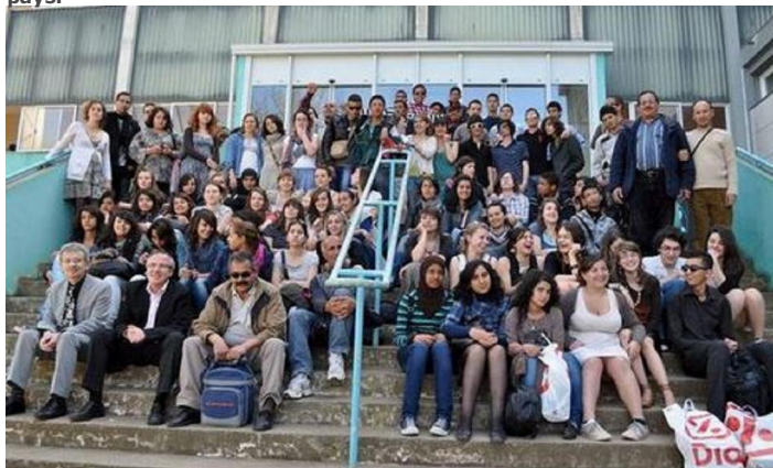
Français et Marocains ont posé devant le lycée Desfontaines, scellant l'amitié entre les deux établissements.

La délégation marocaine du lycée Tarik Ibn Ziad a passé sept jours à Melle. Au programme : la semaine de la biodiversité et la découverte d'un pays.