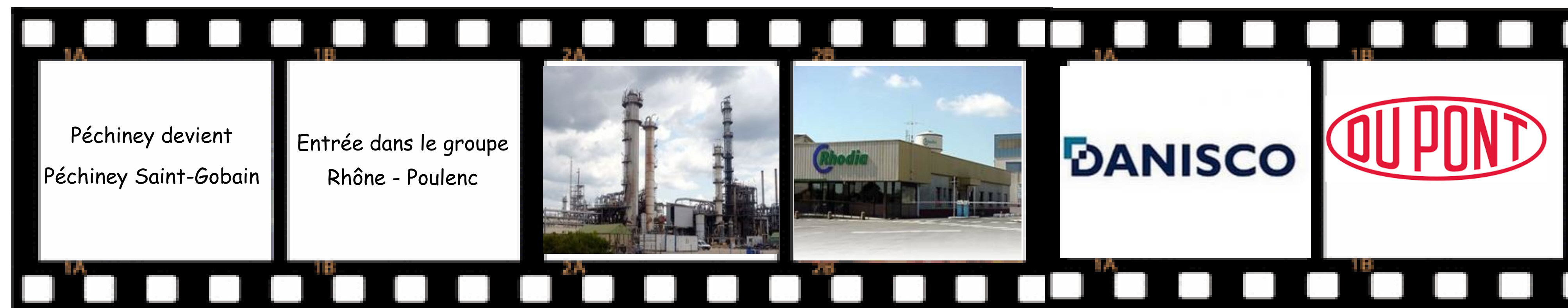
Péchiney devient Péchiney Saint-Gobain Entrée dans le groupe Rhône - Poulenc